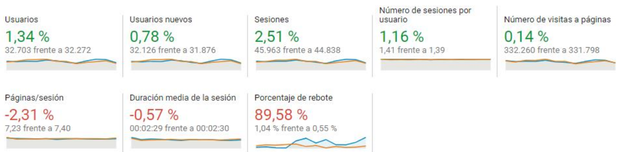
Comparativa de usos y comportamiento durante los años 2017-2018 (Fuente Google Analytics)